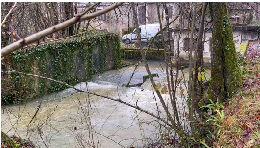
Captage de la DOUCH