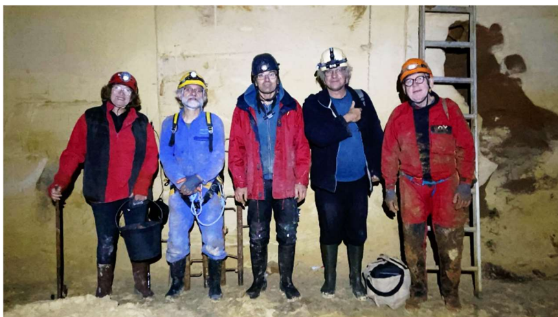
L'équipe a la carrière VEZE