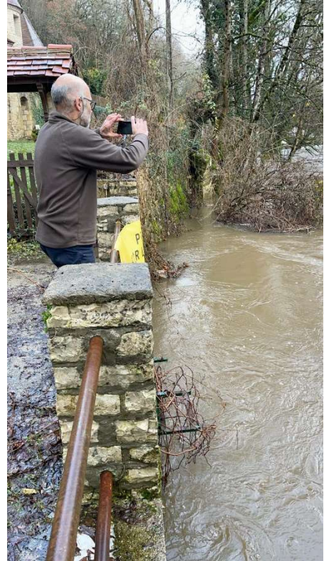
Perte de l'Auvezère