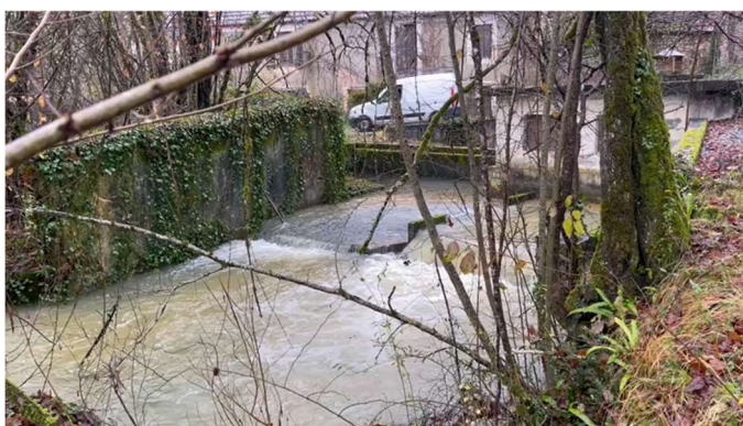
Captage de la DOUCH