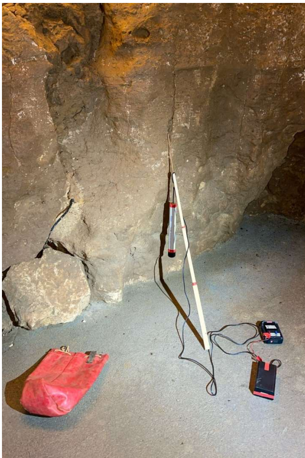
Point N° 1 RadioLoc

Enfin balade dans le trou qui fume qui est toujours de toute beauté et il faut l'avouer fouillé de fonds en comble par nos anciens... avec beaucoup de mérite quand on voit les moyens de désobstruction qu'ils avaient à l'époque ! A noter la présence de nombreuse chauve-souris.