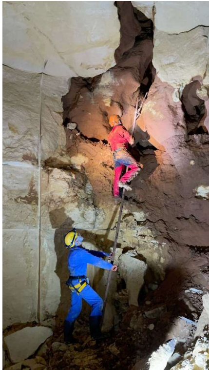
Escalade au Mat