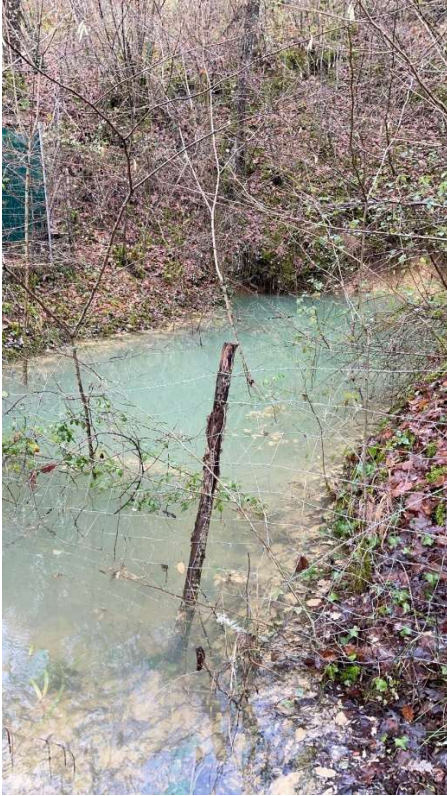
Amont de Gouteblave