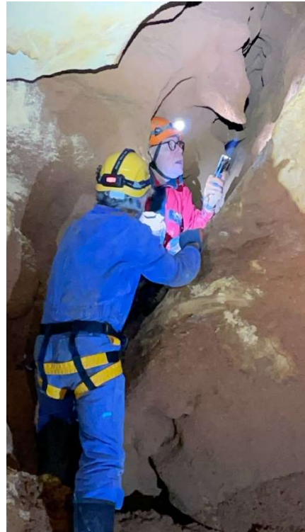
Visite des départs