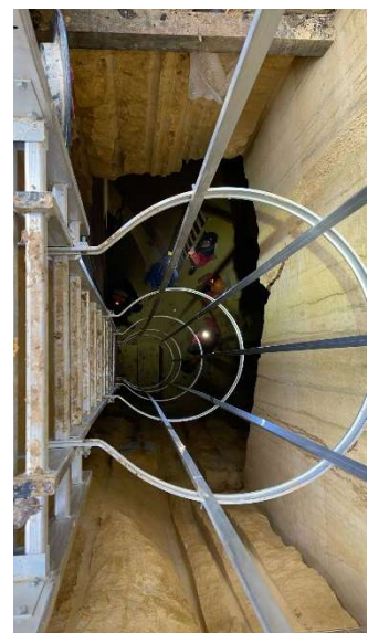
Le puit de Sécurité