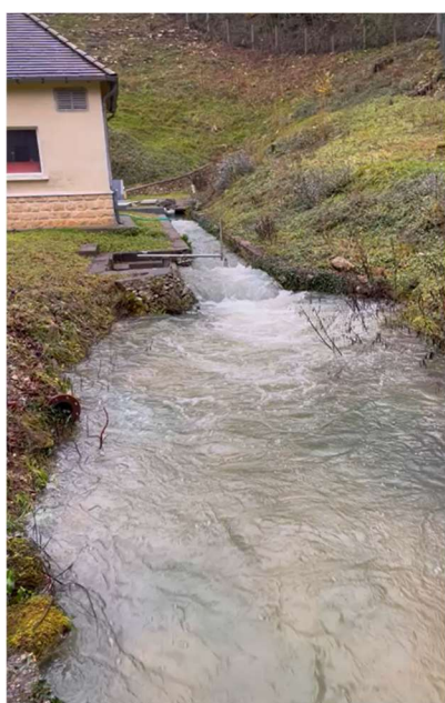
Captage de FAGUEYRET