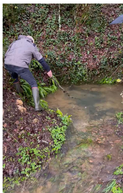
Exsurgence de FALGUEYRET