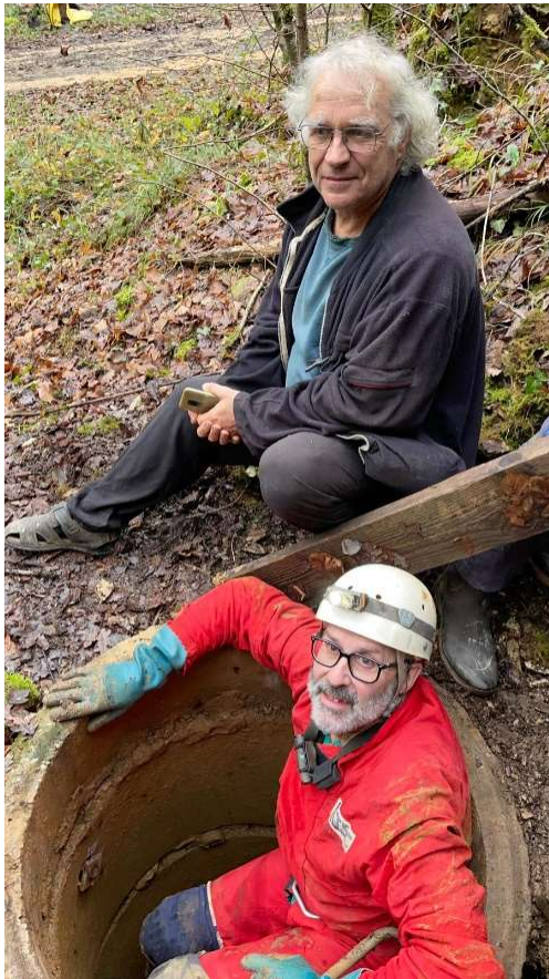
2 des secours

Visite rapide aux Basriches et Font Crue, pour faire des photos pour la commémoration qui aura lieu à la mairie de Rouffignac, fin décembre pour les 40 ans anniversaire du secours.